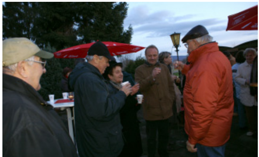
Das Jubiläumsjahr war gerade eine Woche alt – da trafen sich die Genossinnen und Genossen mit ihren Gästen zum Neujahrsempfang „zwischen den Ortsteilen“.