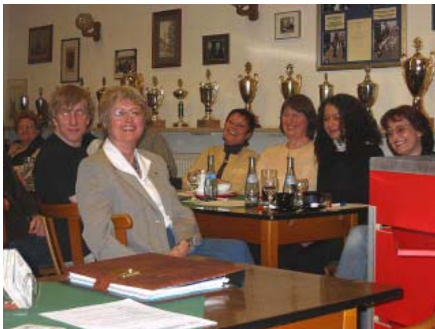
Gute Stimmung herrschte bei der Nominierung der Gemeinderatskandidaten der SPD Edingen-Neckarhausen.

Der SPD-Ortsverein präsentiert eine ausgeglichene und hochkarätige Liste, die sich aus „alten Bekannten“, einem gesunden „Mittelalter“ und jungen, hoffnungsvollen Kräften zusammensetzt.